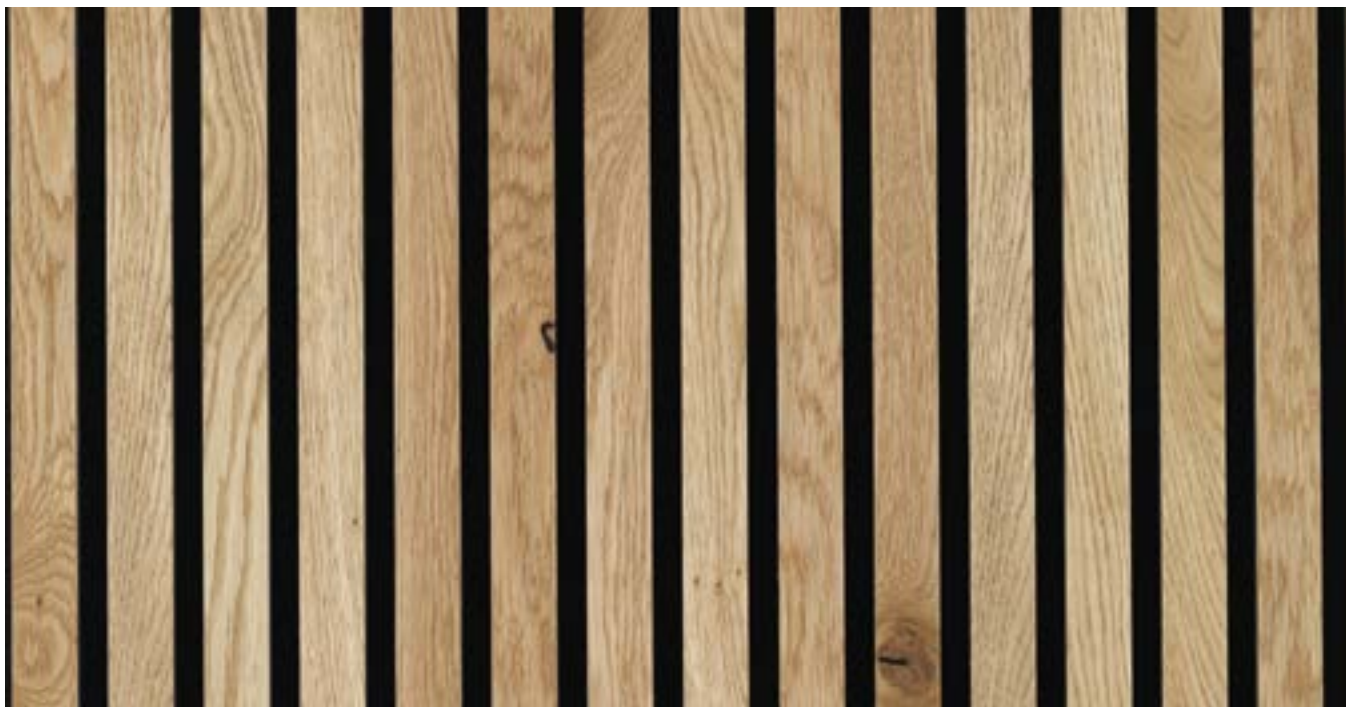
Beispiel Akustik Paneel: Furnier Express Akustik Eiche Rustic Natur